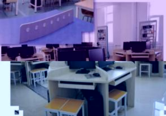
一体化课程教学设计综合实训室