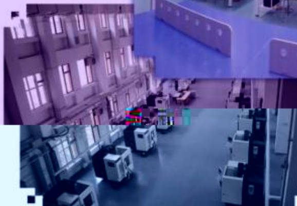
DMG 数控技术训练场所